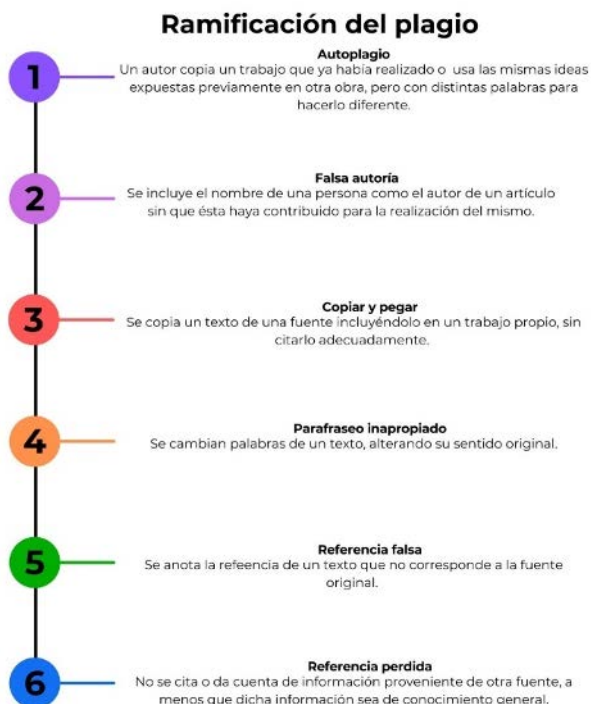
Gráfico 1.