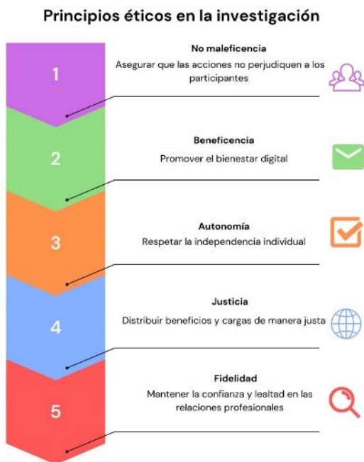
Gráfico 3.

Más allá que esté escrito en los reglamentos universitarios las acciones pertinentes para eventos deshonestos de docentes y alumnos se podrían recomendar los puntos correlativos: