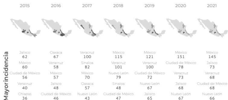
Figura 2. Las entidades con mayor incidencia de feminicidio a nivel nacional del 2015 a 2021 Tomada de: Feminicidios por CESOP. 2022. (p. 4).

Estos datos coinciden con los presentados por el SESNSP (2022), en los cuales los estados que encabezan esta lista son el Estado de México con 120 delitos, seguido de Nuevo León con 81 y Veracruz con 60 feminicidios.