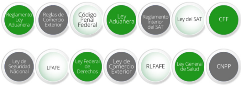
Imagen 4. VUCEM

La VUCEM es una herramienta útil para agilizar trámites y procesos de importación y exportación. Se sustenta en diversas normas que posibilitan su funcionamiento adecuado y la obtención de resultados al emplearla. Dentro de la plataforma es posible consultar el marco jurídico que puede verse en la Imagen 4. Se incluyen las disposiciones centrales del comercio exterior y, además, otros ordenamientos relevantes, como el Código Penal Federal y el Código Nacional de Procedimientos Penales, los cuales coadyuvan a identificar tipos penales vinculados con el comercio exterior o con el ejercicio de funciones públicas, así como el procedimiento para la imposición de sanciones en la vía penal.