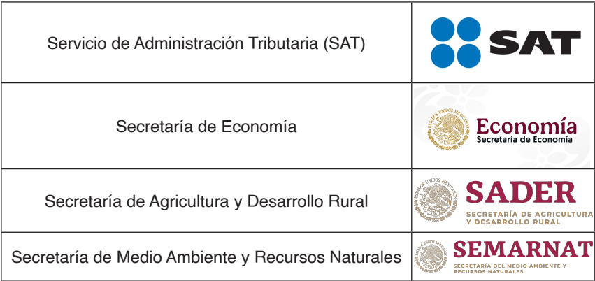
Tabla 2. Dependencias VUCEM

La VUCEM no se concibe únicamente como una herramienta tecnológica para agilizar trámites y documentación, también opera como un instrumento de política pública que impulsa un mayor control normativo e institucional para el equilibrio del comercio exterior. Para que la plataforma funcione adecuadamente, resulta necesario que los catálogos, formatos y reglas administrativas aportados por cada dependencia se armonicen mediante un proceso riguroso y consolidado de gestión, actualizando requisitos y mecanismos de validación en cada caso. Actualmente, la VUCEM cuenta con la participación de once dependencias gubernamentales que intervienen en la recepción y validación de información, a fin de que las personas interesadas obtengan los permisos y demás trámites administrativos solicitados en el portal. Estas dependencias son las que se muestran a continuación en la Tabla 2.