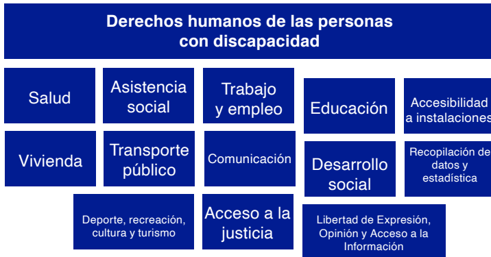
Tabla 14: Derechos humanos de las personas con discapacidad.

Así podemos señalar que los derechos humanos aplicables a las personas con cualquiera de los tipos de discapacidad, son todos aquellos de los que goza cualquier persona, pero dentro de algunos que se deben destacar para garantizarles una vida digna son: